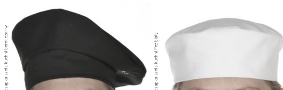
czapka szefa kuchni beret czarny